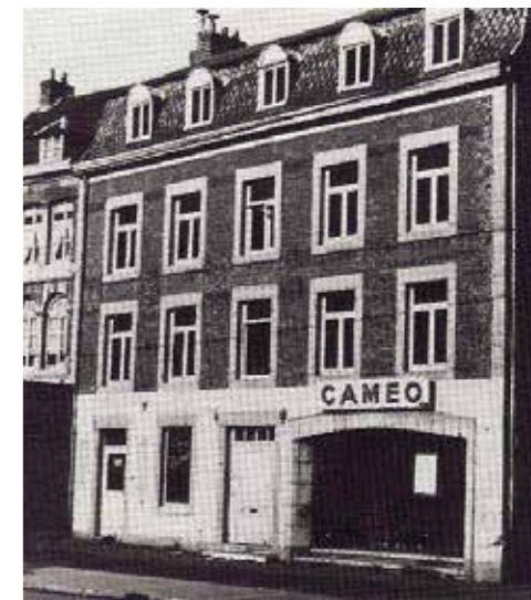
Photo: Dison, place du Sablon, vue de la façade du cinéma « Caméo » (auparavant le café Cambronne) devenu par après le Crédit Communal et actuellement la banque Belfius.