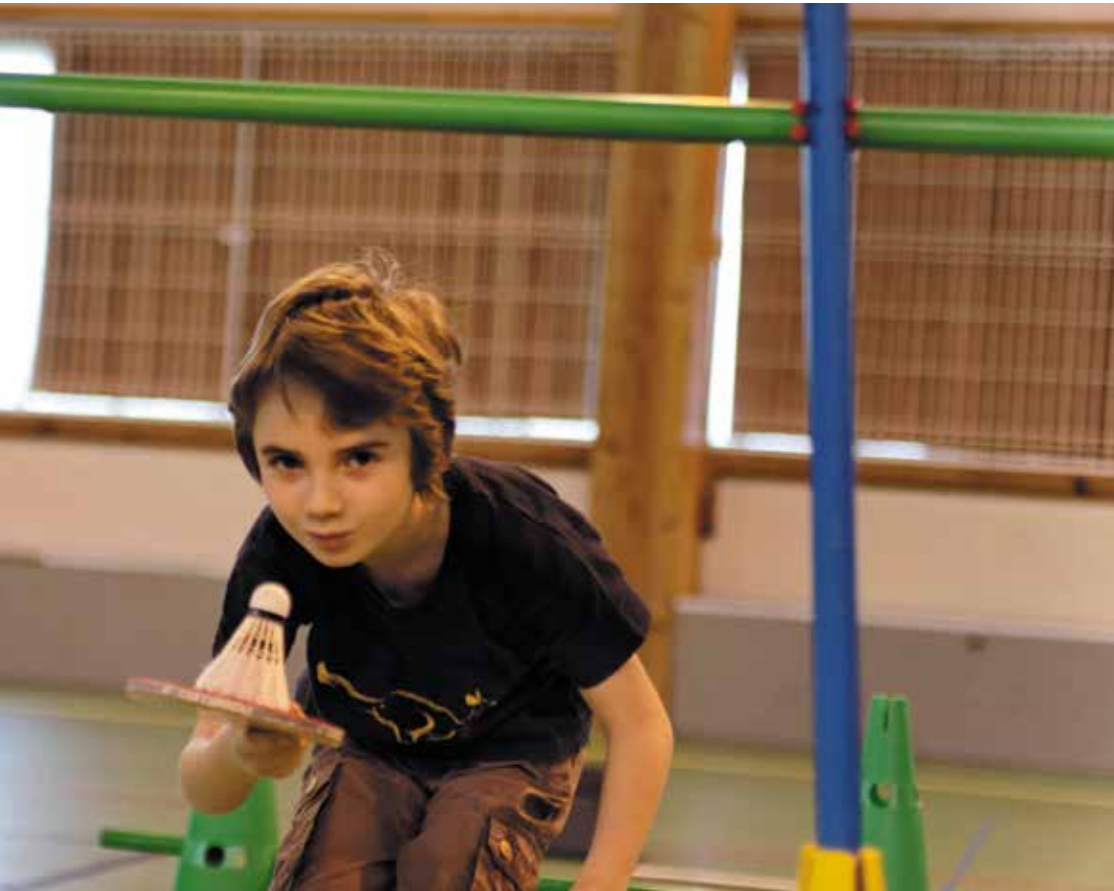
Photo : Séance ludique de psychomotricité lors des entrainements de Baby Ping (La Raquette Disonaise)