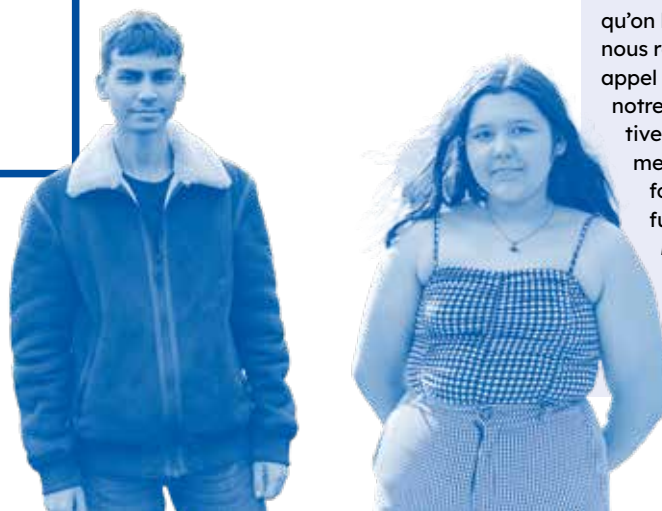
Photo : Les participant-es aux ateliers « Extra & Ordinaire » à Renoupré en pleine action.