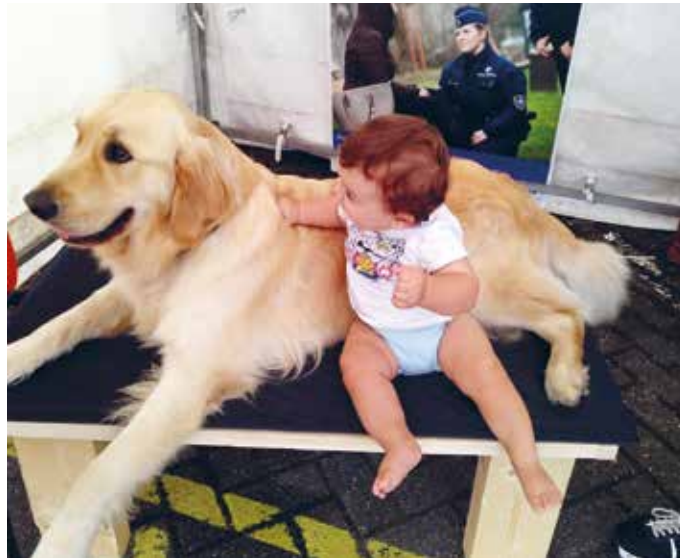
Néo, le chien d'assistance judiciaire, sera de la partie !

gations en tant que propriétaire d'un animal ; - un stand d'information tenu par des membres de notre service d'assistance policière aux victimes et par des membres d'un Centre de prise en charge des victimes de violences sexuelles.