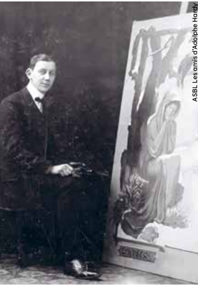
ASBL - Les amis d'Adolphe Hardy