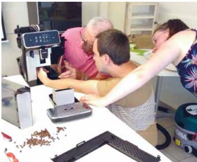
Apprendre à réparer plutôt que jeter, c'est au Repair Café.

Premièrement, vérifiez s'il est encore sous garantie ! Il vous suffira de le rapporter au magasin où vous l'avez acheté.