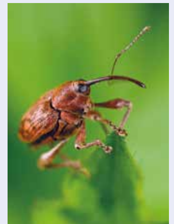
Un balanin des noisettes

tiques aux enfants, du danger de leur prolifération et comment les empêcher en mettant un voile sur chaque tonneau. À quand le retour des noisettes avec des petits enfants dans les campagnes et ces saveurs de pommes du verger, le retour aux maraîchers ? Il y a tant d'enfants qui n'ont jamais goûté une noisette ni un fruit du terroir, et cependant, quel régal ! Bon appétit ! ●