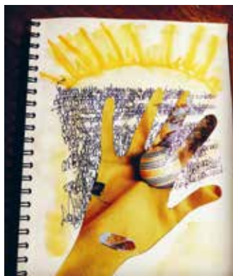
Photo : le projet ALFAIA, de Verónica Codesal, sera mis à l'honneur dans le cadre des Mélodies du vendredi.