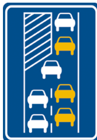
Connaissez-vous ce panneau ?

Toute personne qui n'applique pas le principe de la tirette dans